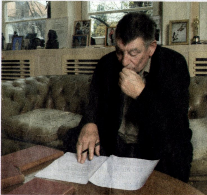
De schrijver J. Bernlef

Traditiegetrouw wordt bij Kunst op Kamers een prachtig kunstboek uitgebracht met een overzicht van alle deelnemende kunstenaars en hun werken. Het boek is dit jaar ontworpen door grafisch ontwerpster Irma Boom, de eerste niet-Amerikaanse vormgeefster die haar oeuvre volgend jaar mag exposeren in het MOMA in New York. Het boek kost € 20,-, inclusief twee toegangsbewijzen.